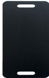
PM-5024 / PM-5025