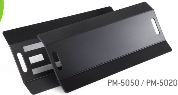
PM-5050 / PM-5020